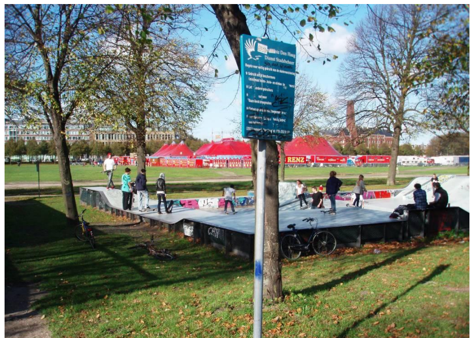
De gemeente gaat over de inrichting van de openbare ruimte

Op de tweede plaats pleit men sterk voor een schoon en groen Den Haag. De verloederding van de openbare ruimte moet worden aange-